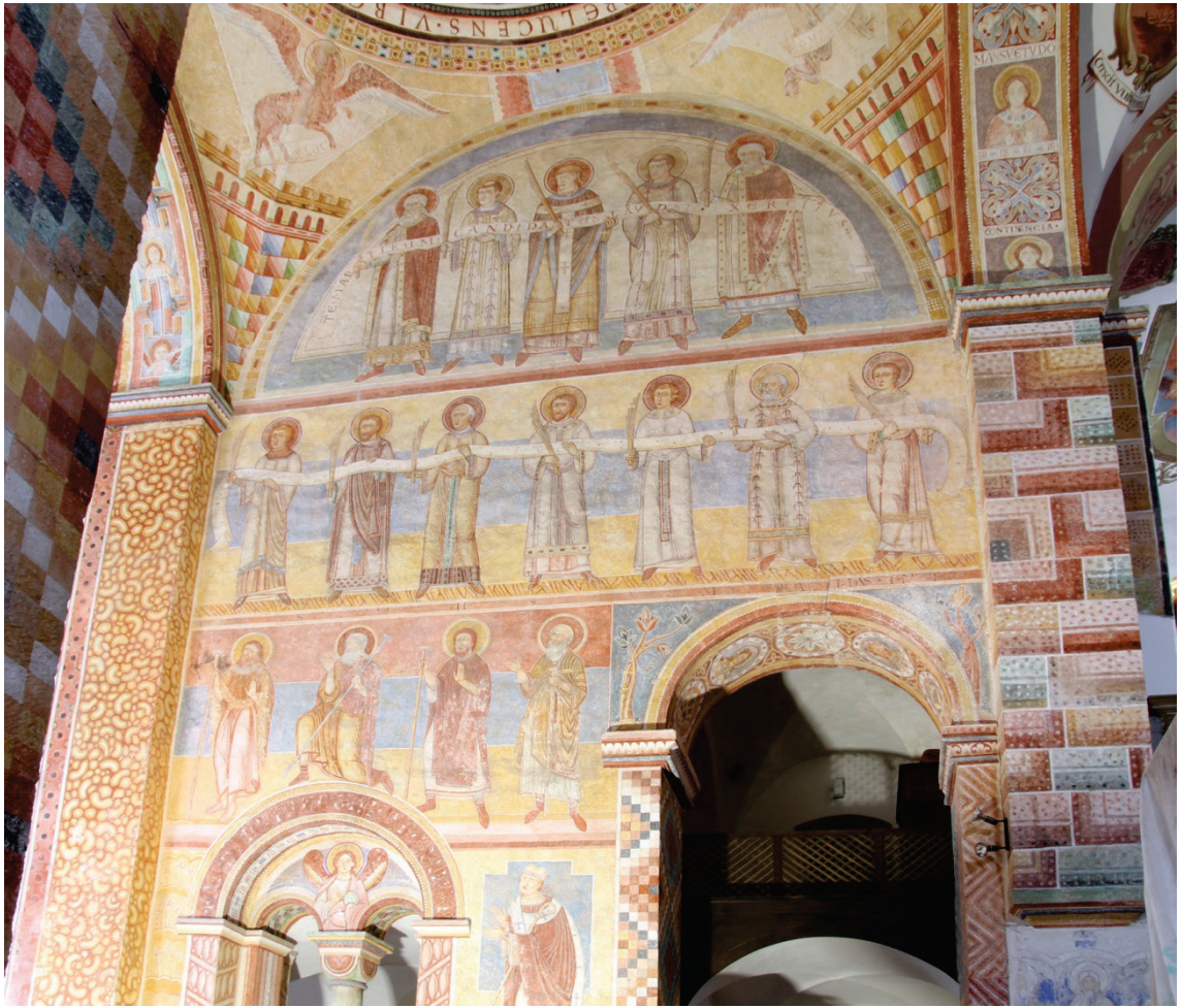
Prüfung, Klosterkirche St. Georg, Presbyterium Gewölbe Kartierung Maßnahmen