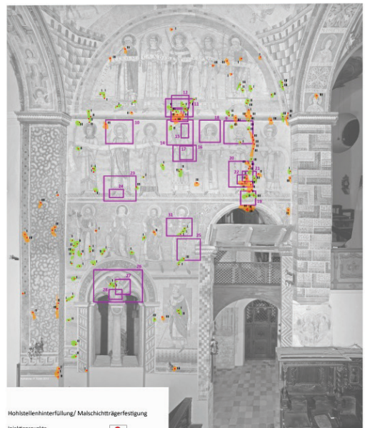
Prüfung, Klosterkirche St. Georg, Presbyterium Südwand Kartierung Maßnahmen

Hohlstellenhinterfüllung/ Malchichtträgerfestigung